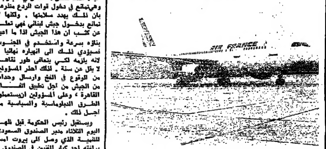
« الأربوس » الفرنسية في مطار بيروت

واعلن لحدود ان اسرائيل تريد التوصل الى التسيتم في لبنان ، ومن اجل ذلك هي تريد ايجاد الجيش نهائيا ، وعدم التمكن من اعادة القصة اليه ، لذلك حصل ما حصل في الجنوب ، وهي تتابع في دخول قوات الردع منوومة بان ذلك يهدد سلامتها ، ولكنها لا تمانع بدخول جيش لبناني فهي تعلم عن كسب ان هذا الجيش اذا ما أعيد بناؤه بسرعة وانضخدم في الجنوب سيؤدي لتلك الى انهيار نهائيا ، لانه يلزمه كسبي يتعاني طور تقاضه لا يقل عن ستة . لذلك اظهر المسؤولون من التوع في الفتح والارسال وحدوات من الجيش من اجل تطبيق الاتفاقية القاهرة ، وعلى المسؤولين ان يستعملوا الطرق الدبلوماسية والسياسية من اجل ذلك . ويستقبل رئيس الحكومة قبل ظهر اليوم الثلاثاء مدير الصندوق السعودي للتسيتم الذي وصل الى بيروت امس برفقة احد كبار التفتيش في الصندوق ، ويستقبل البحث حاجات لبنان في مجال اعادة بناء المرافق العامة . تصريح الحصن وعند مغادرته مكتبه في السراي رد رئيس الحكومة على اسئلة الصحافيين مدنيا بالتصريح التالي : « تركز البحث في شؤون الضمان عامة خاصة بالنسبة للظروف المستجدة بعد الاحداث . كما بحثنا في المراسيم التنفيذية التي مستند خاصة ان قانون الضمان صدر عام ٦٨ ولم يصدر اي مرسوم تنظيمي ومستند قريبا هذه المراسيم » . كما بحثنا في الرقابة على شركات الضمان وكيفية تطبيقها ، فقد صدر قانون عام ٦٨ لغرض سمرة لادوية سيمر الى تطبيقها قريبا . واضاف : اننا مستوردين في درس سياسة تخفيض اسعار الريف ، والدولة تستعمل فرق اسعار الفصح والمستورع الاجازة المسبقة عن كسب من السلع . وظائنا من صندوق النقد الدولي ايجاد خبراء لدرس نظام رفع الاجازات المسبقة التطبيق في وزارة الاقتصاد ووزارتي الزراعة والصناعة والنظ .